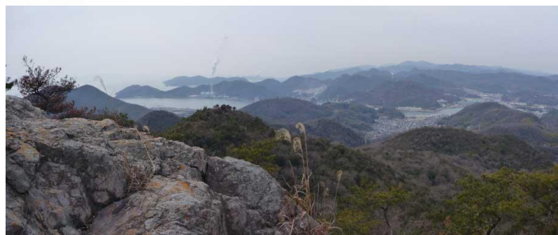
天下台山山頂の立見岩からのパノラマ(相生港・坂越湾・相生市街)