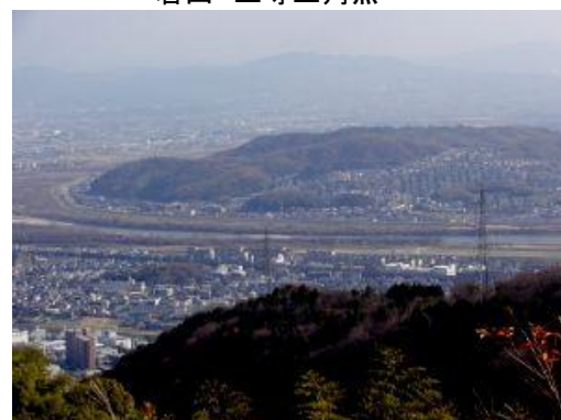
淀川と鳩ヶ峯(八幡) 展望広場より