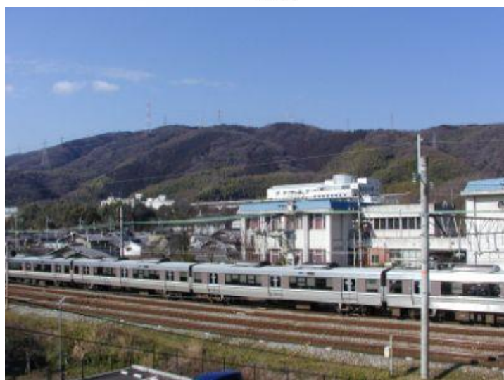
若山 水瀬JR陸橋より