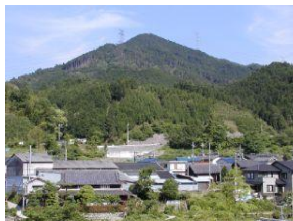
旗尾岳(天見富士) 清水集落より