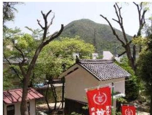
高取山 妙法寺より