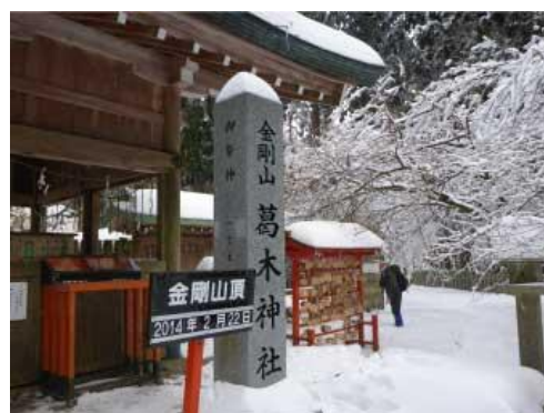
金剛山山頂 葛木神社(標高 1125m)