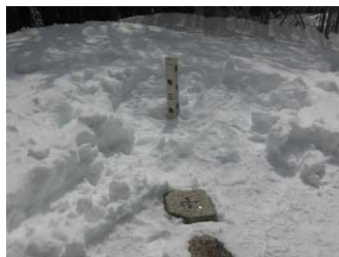
湧出岳 一等三角点