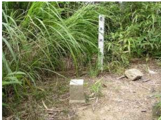
落葉山 四等三角点