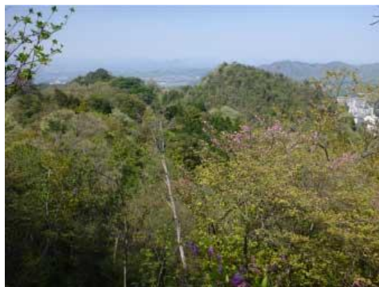
落葉山(北西峰と主峰) 灰形山より