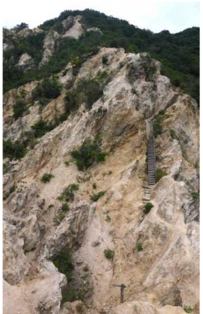
須磨アルプス 馬ノ背