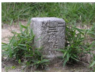
みすぎ山二等三角点