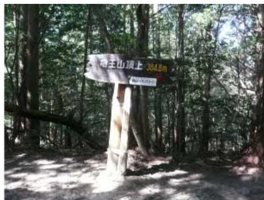
竜王山山頂↑ 鏡山三角点↓