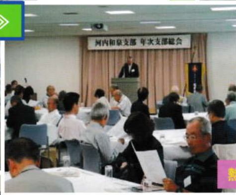
熱心に審議する参加会員