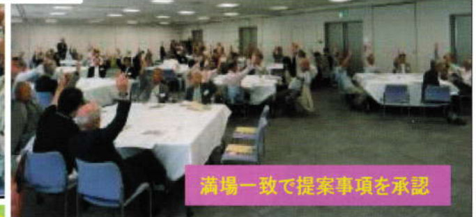
満場一致で提案事項を承認