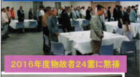
2016年度物故者24霊に黙禱