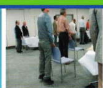
カーレイズ(かかと上げ)