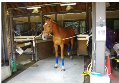
京都府警平安騎馬隊