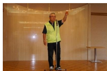
乾杯で昼食スタート