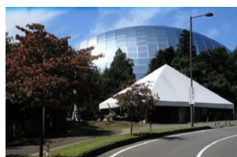
卵型ドームの恐竜博物館