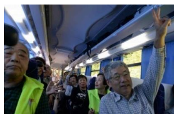
健康クイズで盛り上がりました