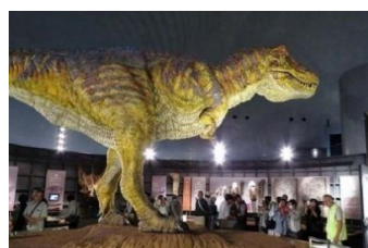
大迫力のTレックス