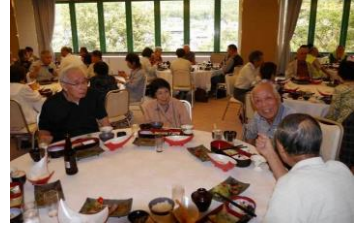
勝山ニューホテルで昼食