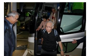
無事、京都駅八条口到着