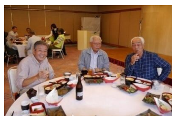
お酒と食事に思わず笑顔