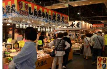
敦賀日本海さかな街で買い物