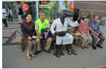
怪獣と仲良く記念撮影

帰途の日本海側最大級海鮮市場「日本海さかな街」で鮮魚、水産加工品、珍味、銘菓などの買い物を楽しんだ後、途中で工事や渋滞に巻き込まれ、予定から少し遅れて18時20分、秋の夕暮れで暗くなった京都駅八条口に到着しました。