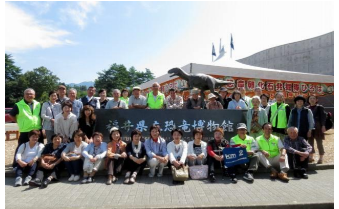
2号車の皆さん(恐竜博物館前)