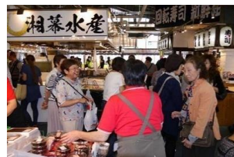
途中、お買い物を楽しんで