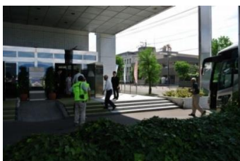
昼食会場のホテルに到着