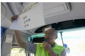
帰路のバス車内では