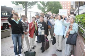
バス号車ごとに整列