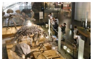
恐竜骨格が40体以上