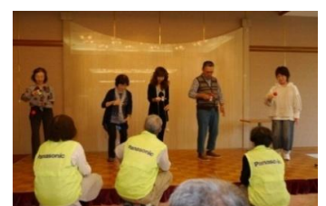
女性が大活躍のけん玉大会