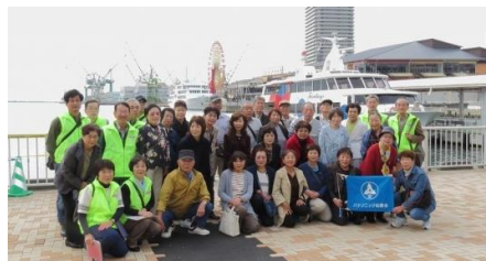
遊覧船乗船前の1号車の皆さん