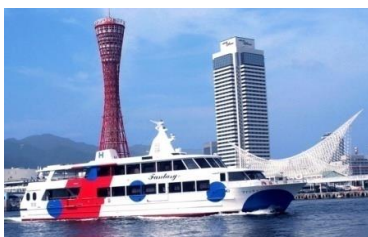
遊覧船ファンタジー号