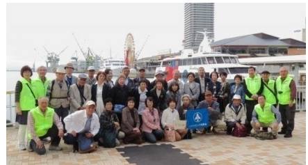
遊覧船乗船前の2号車の皆さん