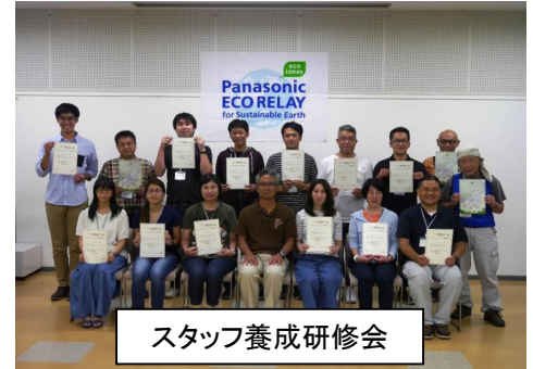
スタッフ養成研修会

3年ぶりとなるスタッフ養成研修会を「ユニピアささやま」にて開催 エコリレージャパンの活動をサポートいただく専門家として 12名のスタッフが誕生した。