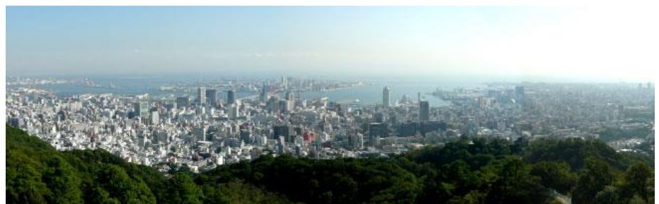
ビーナスブリッジより神戸の展望