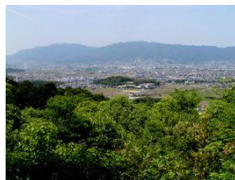
金剛山・葛城連山 畝傍山より