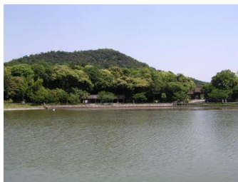
畝傍山 深田池より