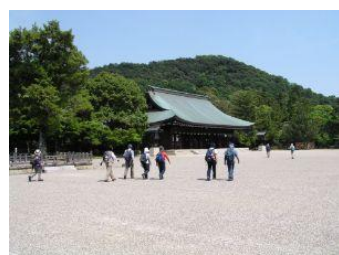
橿原神宮と畝傍山