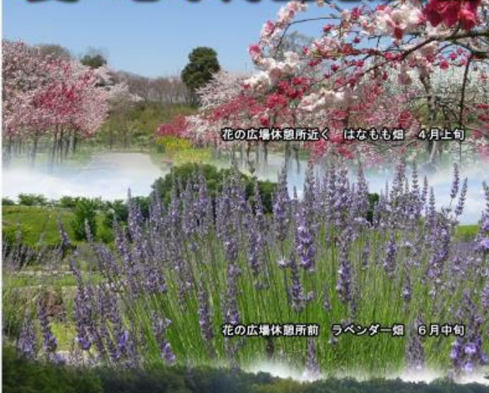
花の広場休憩所近く はなも畑 4月上旬