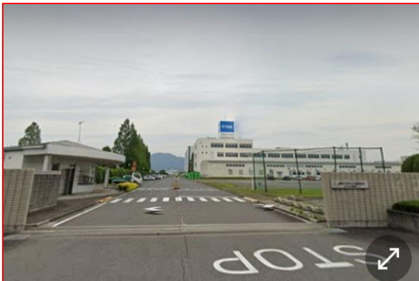
岐阜工場 (現在は岐阜プラスチック)