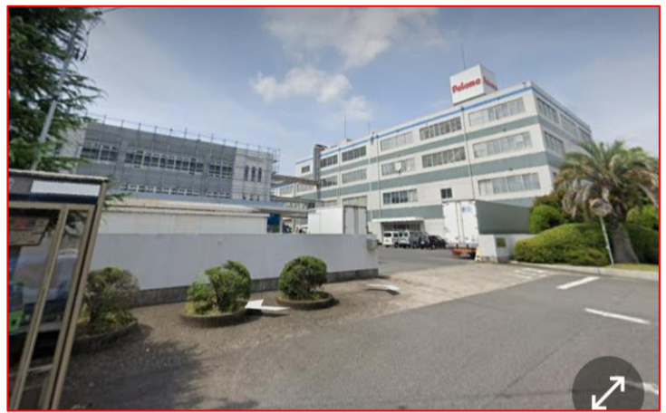
清州工場 (現在はパロマ)