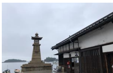
常夜灯。鞆の浦のシンボル

瀬戸内海のほぼ中央に位置し、このあたりで潮の流れが変わることから、古来、潮待ちの港として栄え、歴史的な事件や様々な伝説も残っている。