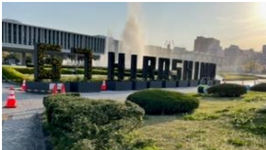
平和公園に『G7 HIROSHIMA』の文字

その様な中で 2023 年度の支部年次大会を、5月14日に広島市文化交流会館にて開催させていただく予定です。新型コロナに関する考え方は昨年と比べ大きく変化していますが、松愛会会員を含む高齢者のリスクが高いこともあり、十分な対策を行った上で、大会を開催させていただきますので、会員皆様におかれましては、お誘い合わせの上ご参加頂きます様お願い申し上げます。