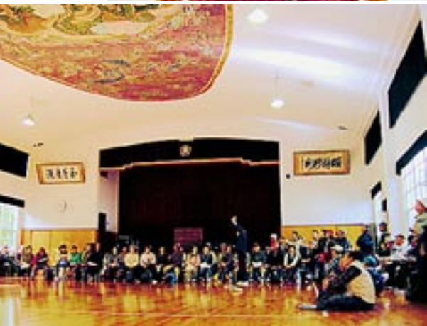
明治21年に建設された大阪博物館美術館にあった巨大天井画「双龍鳳凰」が昭和13年にできた大講堂に移設