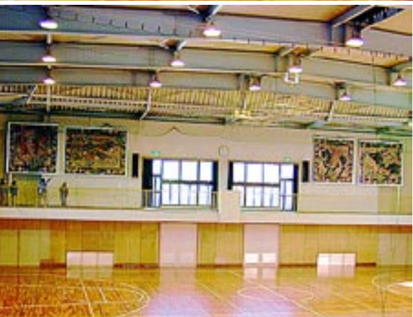
22枚の壁画の内4枚は同窓生有志の寄贈で体育館に修復展示、1枚は滝井の同窓会館に展示、残り17枚は体育館倉庫に眠っている