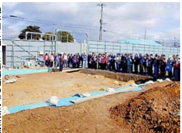
穂谷川に面した南斜面の府営坂住宅が高層化のため立て替え中、この地には弥生時代から先人が居住した跡が九頭神遺跡として発掘されている