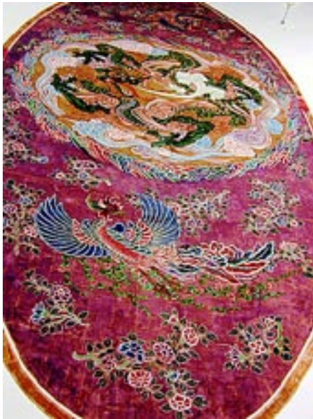
巨大天井画「双龍鳳凰」15×6米の巨大天井画は日本画家の上田耕沖や櫻井香雲が法隆寺寺物の模写をしたもので貴重な文化財