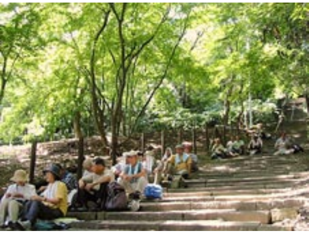
公園まで下りずに木陰の多い聖天さんの参道で昼食場所を確保する