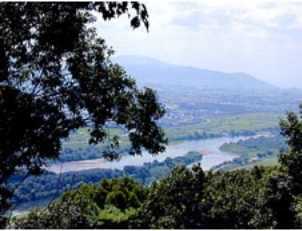
展望台からは、眼下に木津川との合流地点の八幡背割り堤が見下ろせる