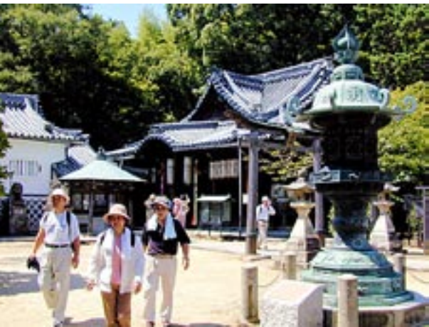
山崎聖天(観音寺)で無事の下山に感謝