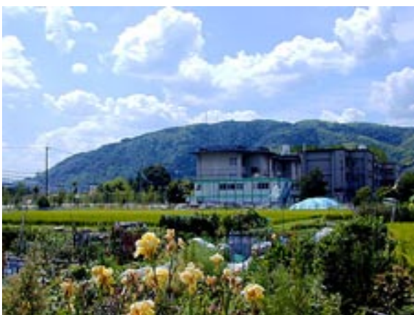
桂の田園地帯から今下りてきた天王山を振り返る

ざした。閻魔堂の横から登山道へ進むと木陰があり、暑さを少し和らげてくれる。約15分ほどで最初の休憩所につき、噴出す汗にこちらのコースを選んだ愚痴もでる暑さである。