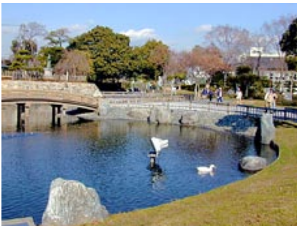
城主高山右近の銅像があり奥に見える島上高校の辺りが高槻城本丸の址、右近は13年間治世

ちっぽけではあるが、どことなく格式がしのばれるスサノオノミコト神社の境内を突き抜けて、