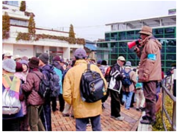
近鉄線が相互乗り入れする地下鉄北大路烏丸駅で一次解散