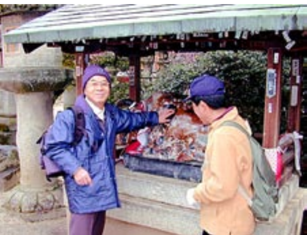
境内にある撫で牛の像は、菅原道真公が亡くなった年・日・刻から奉納、撫でた箇所は御利益があるという