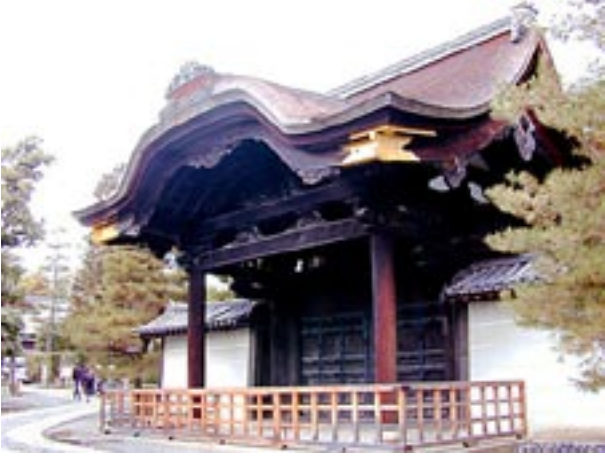
大徳寺三門のすぐ南隣にある勅使門