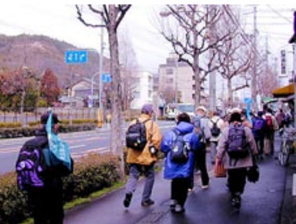
左大文字を左前に見ながら西大路を北に向かい金閣寺道を東に折れる

金閣寺道を折れ北大路を東に向かって進むと、右手に船岡山公園が見えてくる。海拔112mの小高い丘は、枕草子などにも詠み込まれているように古来から王朝貴族の遊宴の地であったが、平安中期以降は葬送の地となり、応仁の乱や永正の京都争奪戦の古戦場となった。現在では公園になっており、この丘からは京都五山の送り火が全て観覧できる。この公園で昼食休憩とつたが、雲の切れ間から雪の比叡山山頂や火床が雪文字になった東山大文字が顔を出してくれた。