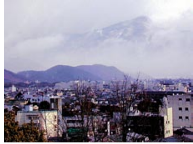
船岡山公園休憩所で雲の切れ間から雪の比叡山が覗けた

古来は王朝貴族の遊宴の地、平安中期以降は葬送の地、応仁の乱や永正の京都争奪戦の古戦場、船岡山公園で昼食