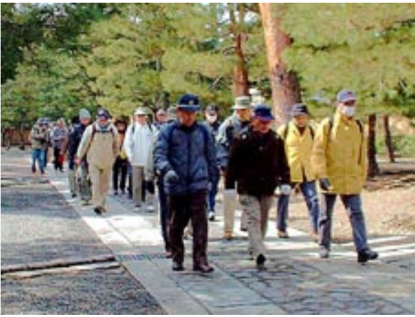
松の古木が並ぶ大徳寺参道を歩く