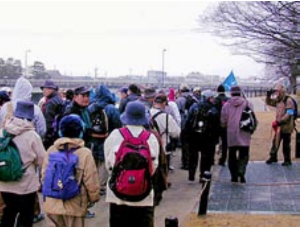
出町柳近くの河原で本日の例会は解散、ようやく雪は降り止んでいた