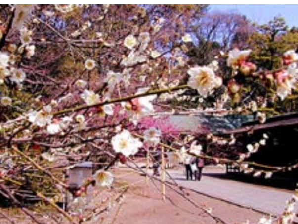
北野天満宮には約二万坪の境内と梅苑に50種約二千本の梅がある