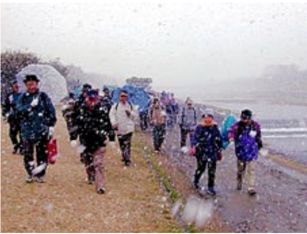
激しい雪の鴨川右岸を出町柳に向かって歩く