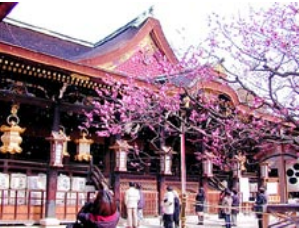
莊嚴な本殿、社殿などは国宝で、豊臣秀頼が寄進した桃山文化の粹