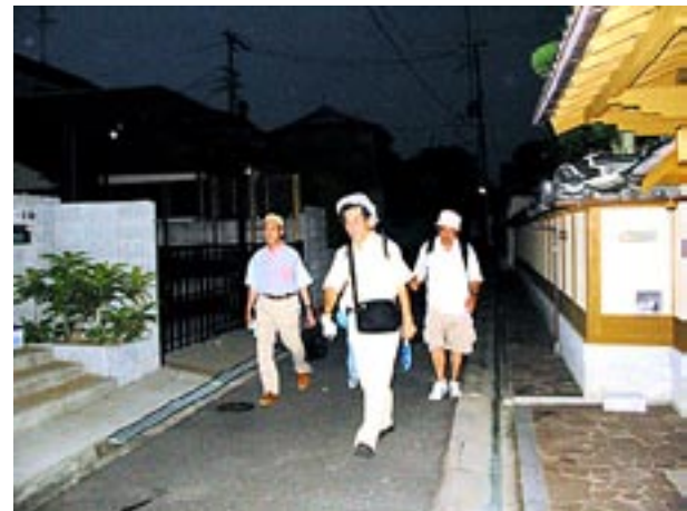
香里園町の瀟洒な住宅街を行くと、駅はもうすぐそこだ