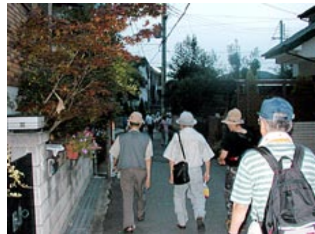
バス道を外れ菅相塚の住宅街を行く