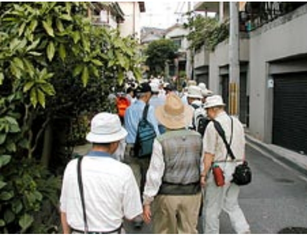
藤田町の新興住宅街を登ると桑が谷公園に出る