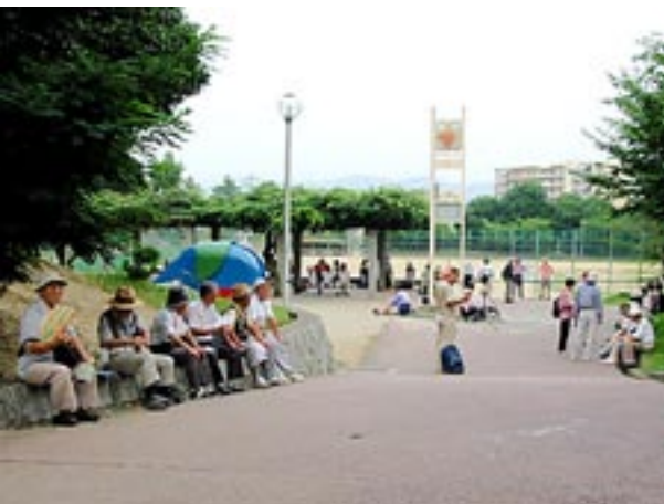
香里ヶ丘中央公園のグラウンド外周を半周し藤棚のある時計台の下で休憩

物の向こうに隠れて見えないがまだ周囲は明るい。とにかく、風がなく蒸し暑く、皆、持参の飲み物で喉を潤して休んでいる。少し長めの休憩を終えて6時40分に出発。公園を出て信号をわたり南へ下り、再びけやき通りへでる。ピーコックは左うしろに見えている。聖徳会館、最近できたデイサービス香里丘苑、改装された勝山愛和香里ヶ丘幼稚園を右に見て進む。