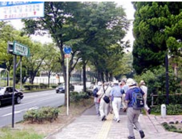
藤田川の交差点に到着、右に折れると枚方八景のひとつ「香里団地けやき通り」の東の起点