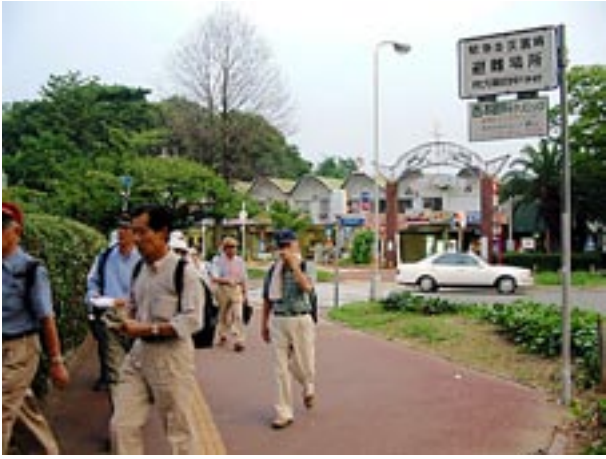
ピーコック通りをあとに新香里前のけやき通を行く