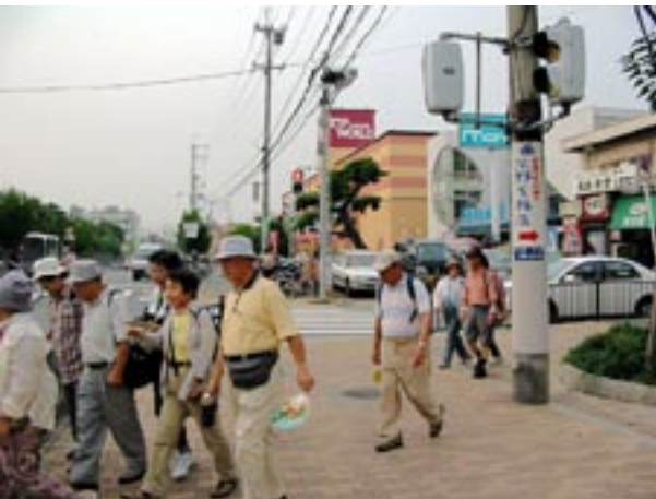
生鮮食品館TOPWORLDが新設された香里橋交差点