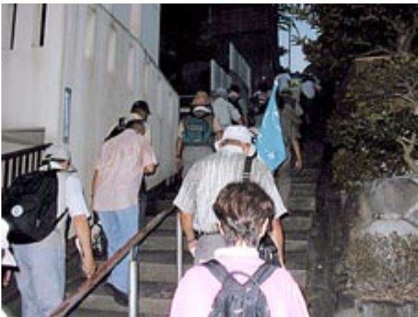
階段を上がり香里園町へ出る