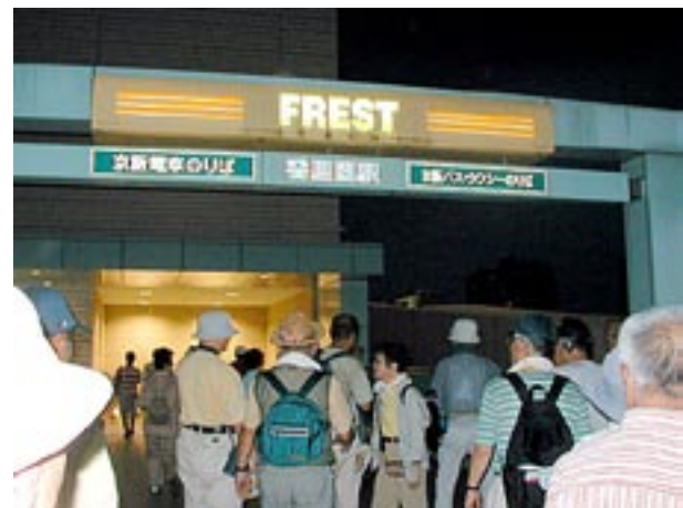
今日のたそがれウオークは京阪香里園駅フレスト前で解散