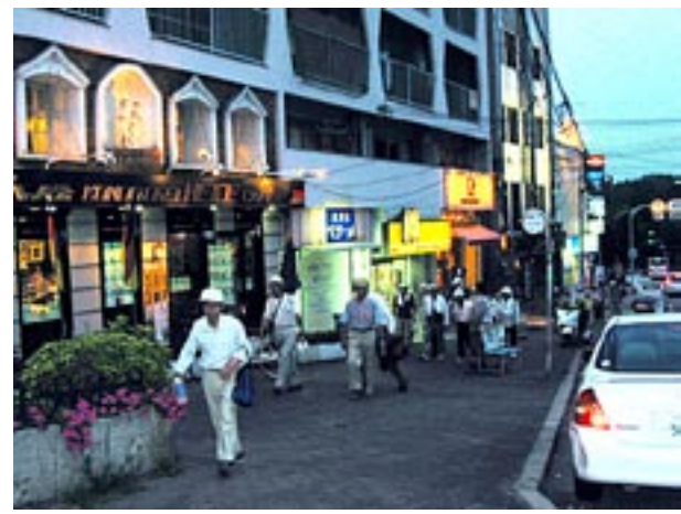
香里ヶ丘バス停付近まで登るとお店の明かりが灯りだした