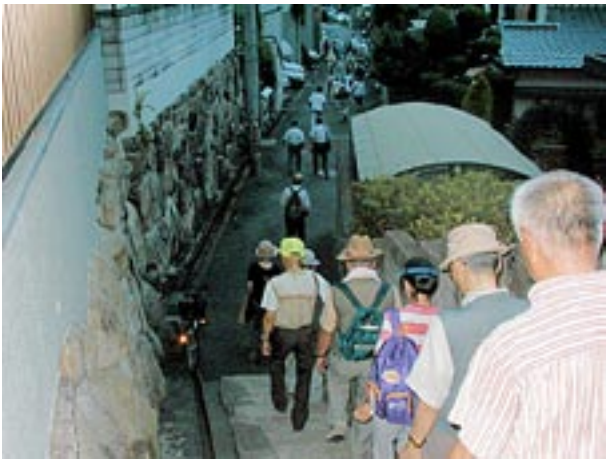
香里ヶ丘から菅相塚町へ細い階段を下る