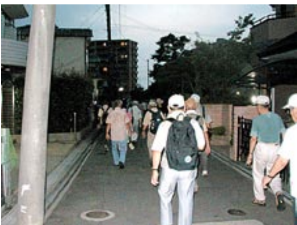
東香里園町と香里園町間の路地を行く、西の空に遠雷が聞こえ一陣の涼しい風が吹く、香里園駅まであと僅か