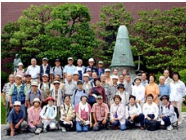
ウイスキー館前で記念撮影、Aグループ(第九十九回例会 九月七日)