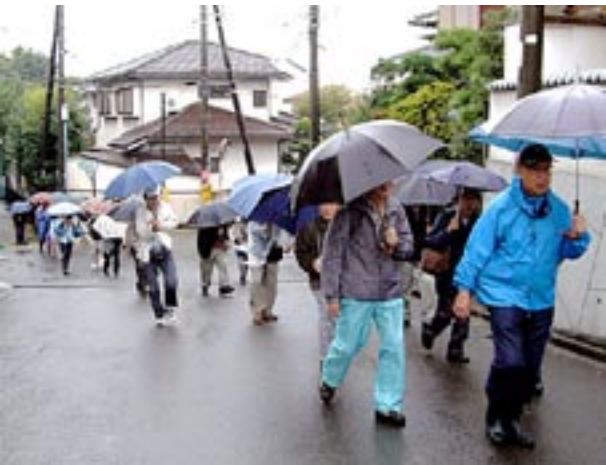
橋本の新興住宅街に行く