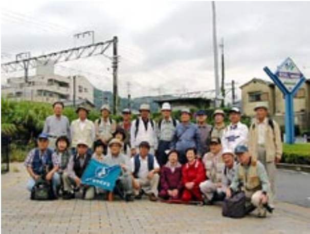
百回記念誌用、前回撮影漏れの参加者の記念撮影(第百回例会 十月五日)