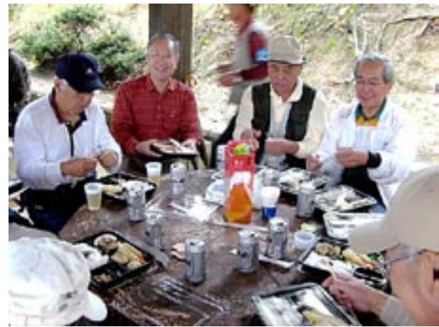
くらわん会の百回記念を祝いあった