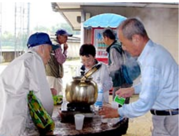
第2班も男山レクリエーションセンターに到着、先発班が沸かしてくれたお茶を飲む