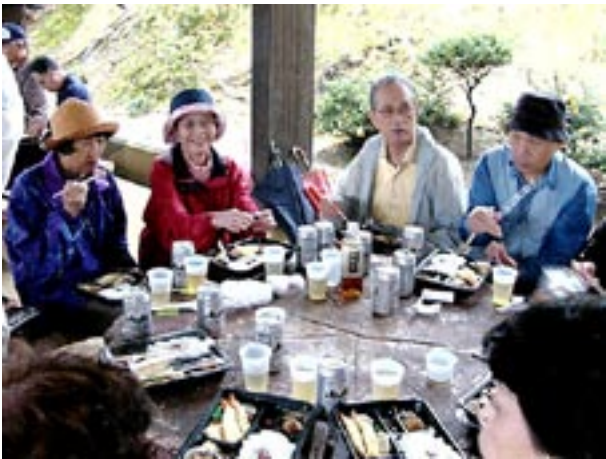
会費1000円で用意された、特別手配のお弁当が配られビールで乾杯