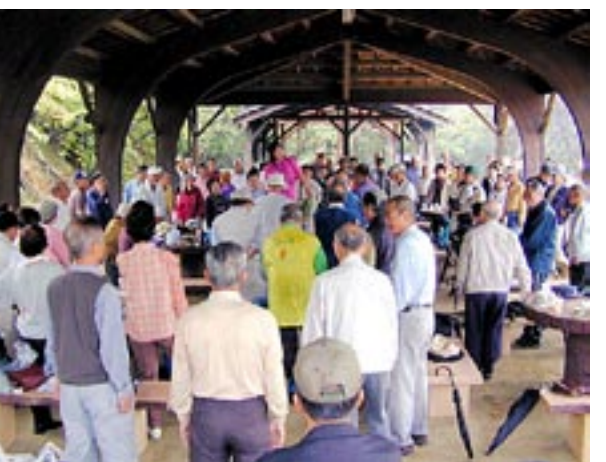
ウォーキングの正しい姿勢などの実践を受けた