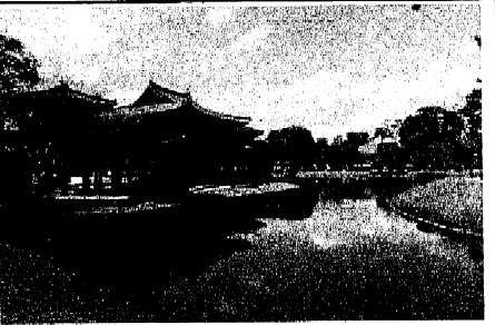
平等院・浄土式庭園 拝観