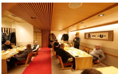
忘年会/参加人数/17名/挨拶・乾杯