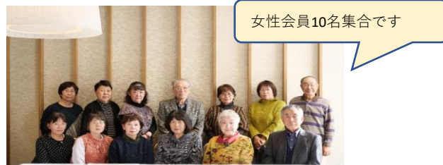
女性会員10名集合です