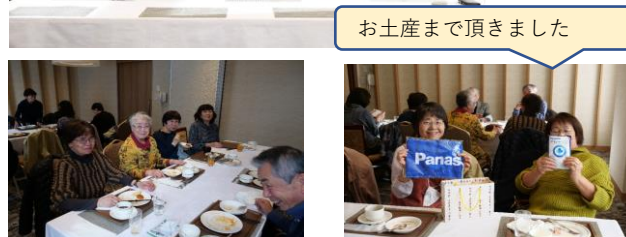
お土産まで頂きました

ウィズコロナ、4年ぶりの再開でしたが 皆さんお元気で生き活きてましたよ (世話役談)