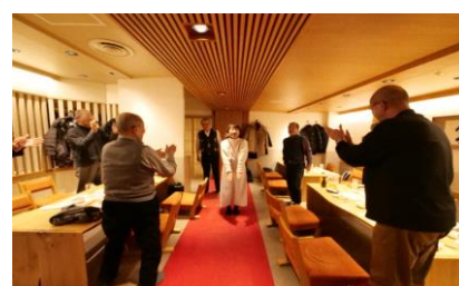
新会員&本日の紅一点を紹介!