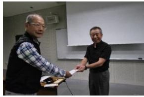
隔月懇談風景 脳トレゲーム参加賞贈呈