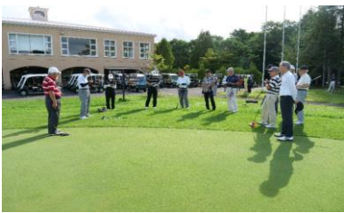
募金額も近年になく集まり 本当に感謝で一杯でした