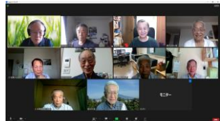
北のEとも 9月16日 / テーマ: 「PC更新物語」 10月7日 / テーマ: 「進化するハイブリッドSYS」 情報交換会 10月28日 / テーマ: 「川柳を作ってみよう」