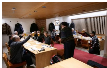
忘年会 / 参加人数 / 16名 / 挨拶・乾杯