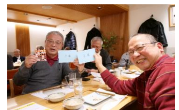
ビンゴゲーム & お土産付きでした