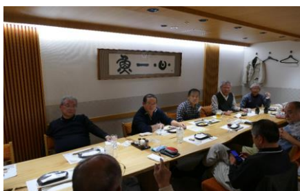
参加人数 / 10名