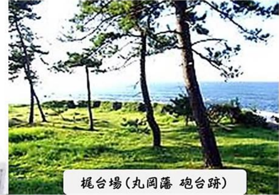
梶台場(丸圃藩 砲台跡)