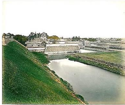
富士見櫓と周辺の堀(1885年~1890年頃に撮影)