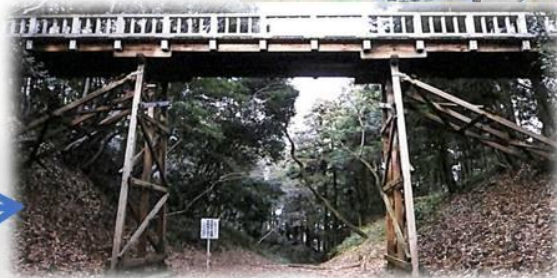
本丸と中の丸の間の堀切