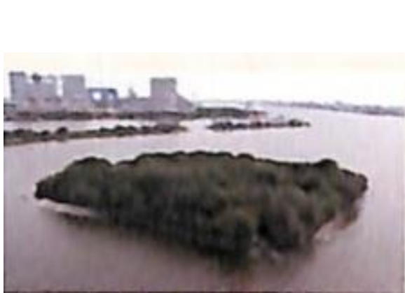
御台場復元CG (フジテレビジョン作成)