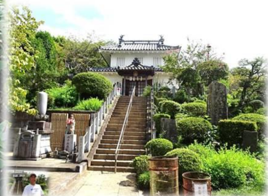
真浄寺七面堂(八幡台櫓) 本丸の八幡台にあった二重櫓(1880年に移築)