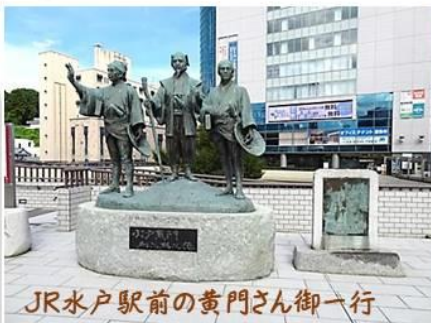
JR水戸駅前の黄門さん御一行

しかし丁度子供の下校時間だったのか、突然立派な門から子供たちが元気いっぱいに出てきたときには、周りの風景とそぐわないのには思わず笑ってしまいました。