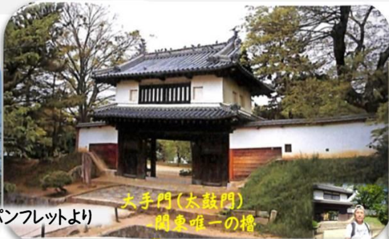
パンフレットより