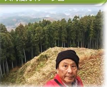
本丸から城下町眺望