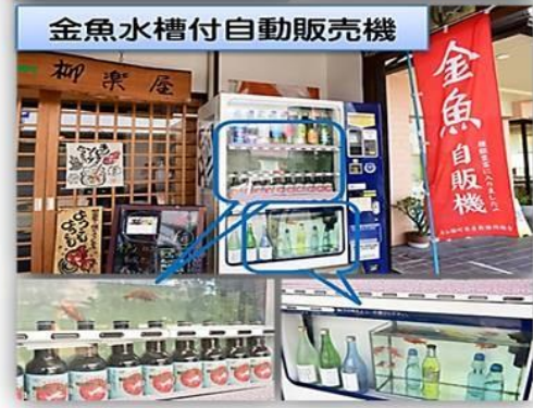
金魚水槽付自動販売機