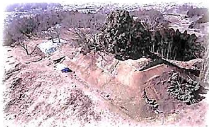
宇陀松山城跡本丸・天守閣(南東から)