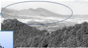
二上山にじょうさん