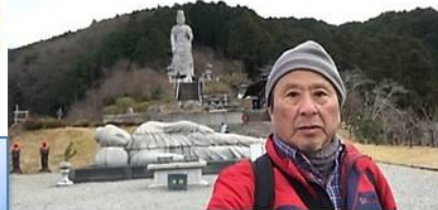
天竺渡来大観音石像(立像) 天竺渡来大涅槃石像(寝像)