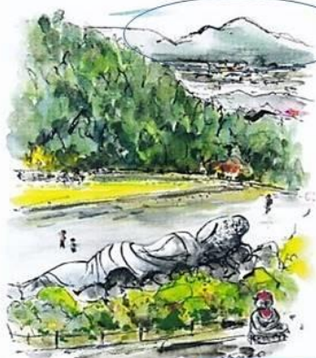
壺阪寺から二上山の眺め