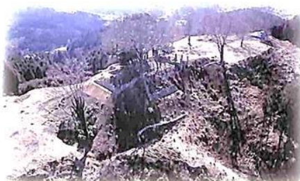
宇陀松山城跡本丸・天守閣(北東から)