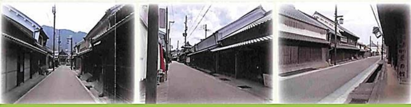
「重要伝統的建造物群保存地区」内