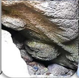
天守台転用石 (逆さ地蔵)

【一口メモ】 * 郡山城で生まれた“ことわざ” 「洞ヶ峠を決め込む」 or 「洞ヶ峠」ほらがとうげ 意味：日和見する 解説：羽柴秀吉と明智光秀が京都の山崎で対陣したとき、筒井順慶が天王山の南にある洞ヶ峠に布陣して、勝敗の行くえを見守り、有利なほうに荷担しようとした故事によるもの。 * 洞ヶ峠—京都府八幡市八幡南山と大阪府枚方市高野道・長尾峠町の境にある峠。