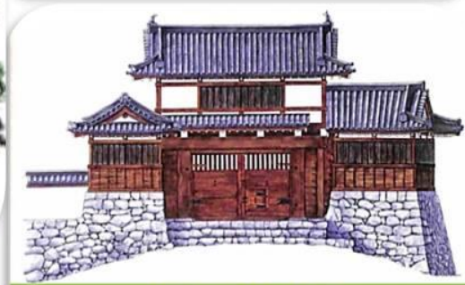
大門復元イメージ図