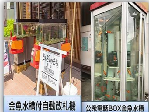
金魚水槽付自動改札機 公衆電話BOX金魚水槽