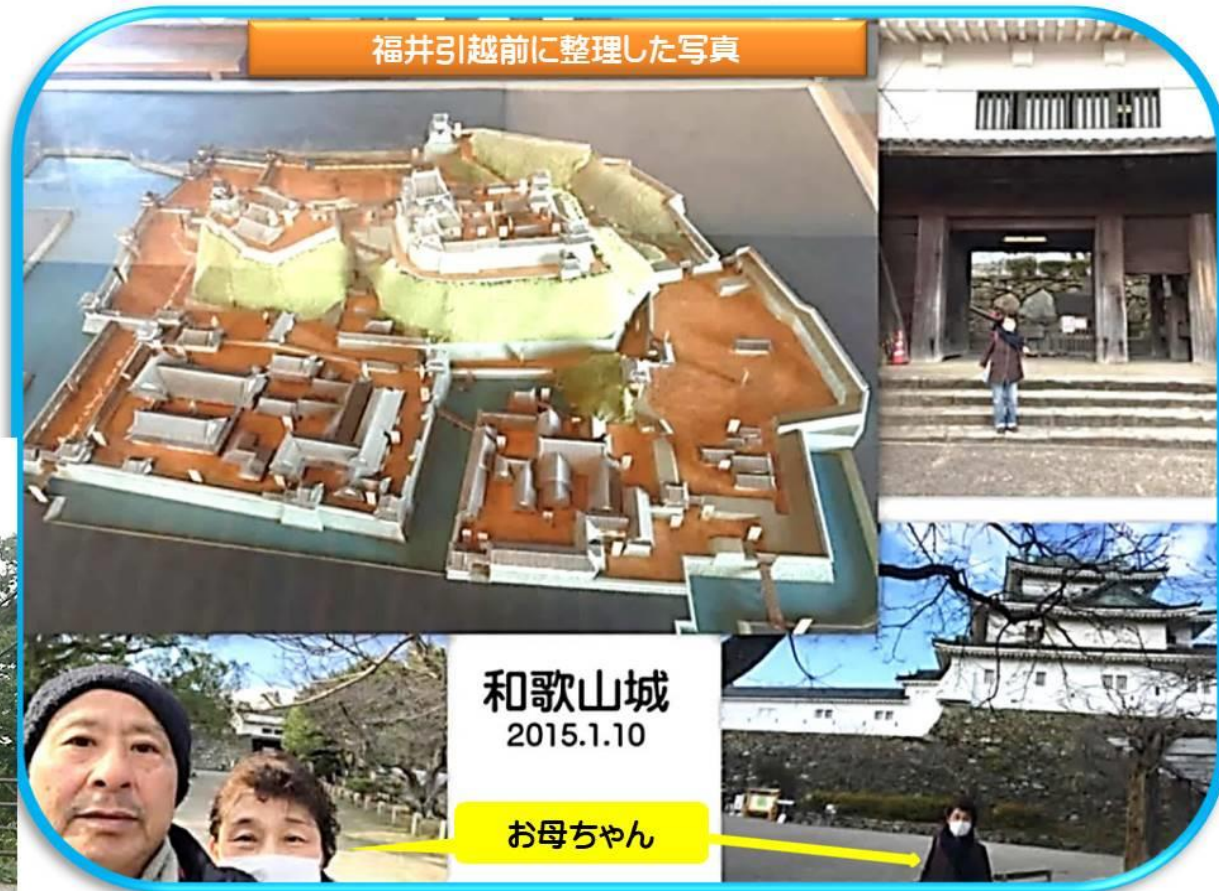
福井引越前に整理した写真