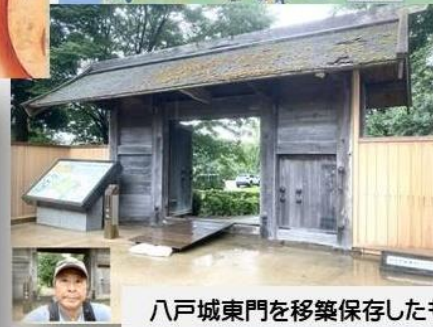
八戸城東門を移築保存したもの