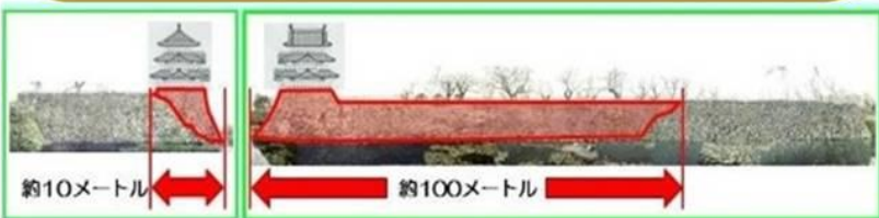
【想定図】天守曳屋工事（平成 27 年秋）

2015年---天守を北西へ70m移動---「曳き家」工事 石垣は、天守台南面約10mと東面約100mの修繕 2025年---天守曳き戻し