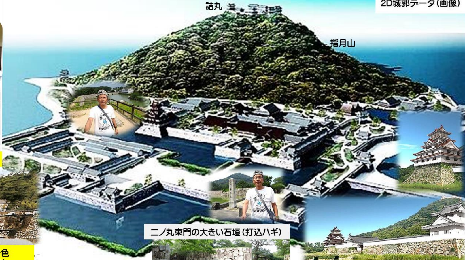
二ノ丸東門の大きい石垣(打込ハギ)