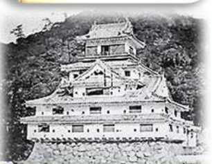
天守古写真(明治期)