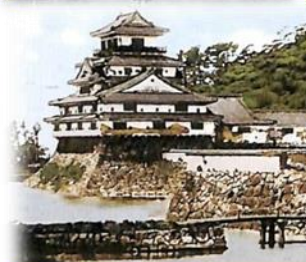
CG処理による着色 (前田利久氏加工)