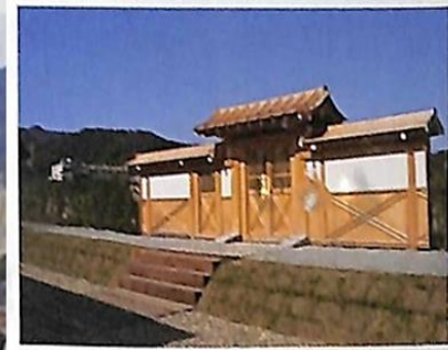
大内氏館の復元西門 屋敷地内を仕切る西門。内郭と外郭を繋ぐ内門であったと思われる。