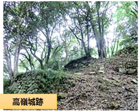
高嶺城跡 国の史跡に指定され石垣等の遺構