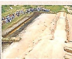
南辺築地跡