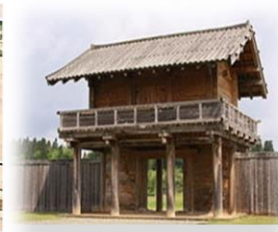
復元された払田柵南門