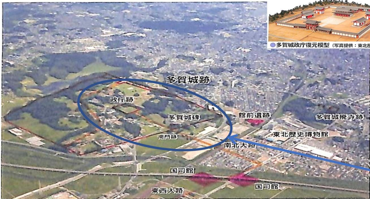
多賀城跡航空写真