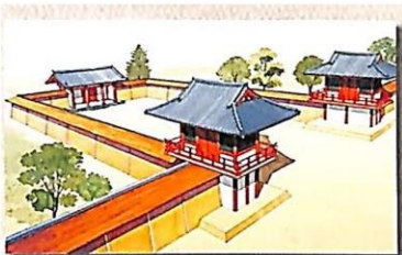
平安時代の東門復元図