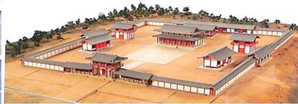
●多賀城政庁復元模型

今年の3月の異常温暖で宮城ですら葉桜に近い状態で、愛でるのを楽しみにしていましたが残念な結果でした。