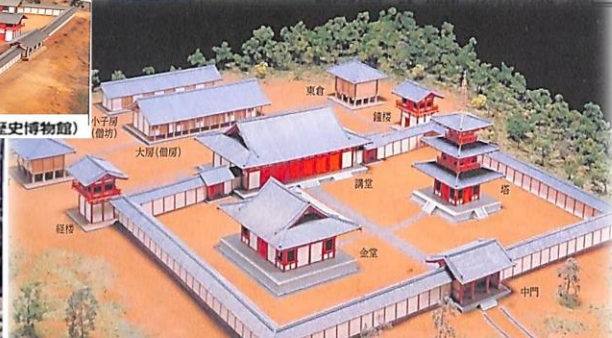
多賀城廃寺復元模型