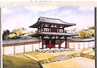
多賀城南門復元イラスト