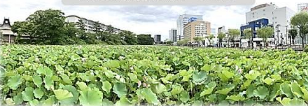
久保田城跡前お堀の一面の蓮