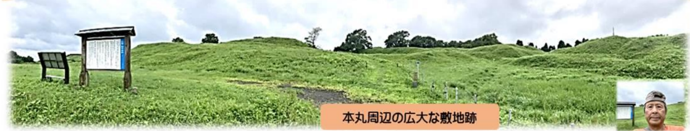
本丸周辺の広大な敷地跡