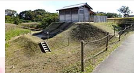
鶺ノ木地区のトイレ遺構(復元) 、古代水洗厠舎跡

城郭外の遺構（鶺ノ木地区）において規則的に配置された大規模な 掘立柱建物 群の遺構と、水洗トイレの遺構などが検出されています。