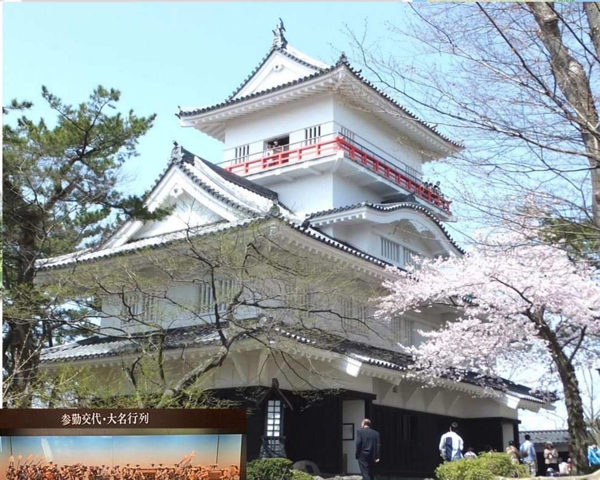
参勤交代・大名行列