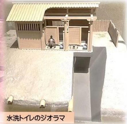
水洗トイレのジオラマ