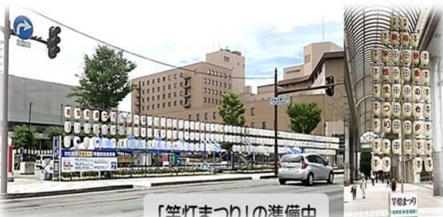
「竿灯まつり」の準備中

秋田県は2度目です。弘前城投稿時紹介したように、学生時の東北3大祭り制覇旅行時に来ました。もちろん「竿灯祭り」でして、今回のこの日は明日からの祭りの準備で活気づいていました。