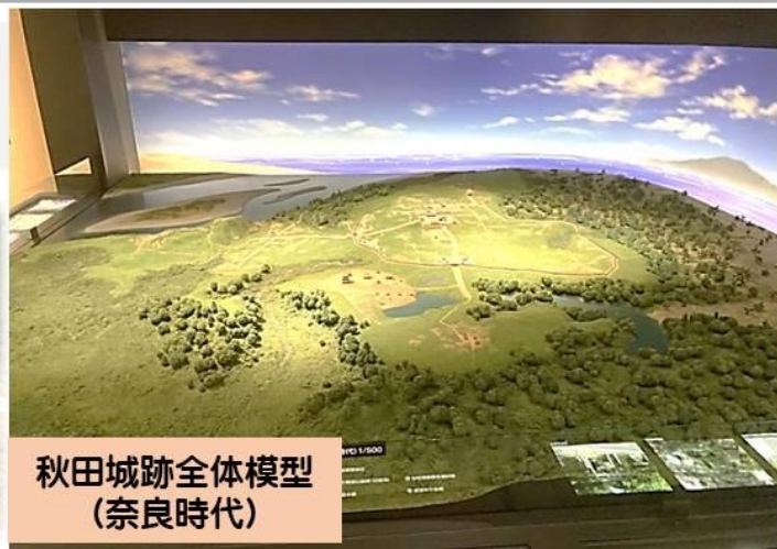
秋田城跡全体模型 (奈良時代)

城郭外の遺構（鶺ノ木地区）において規則的に配置された大規模な 掘立柱建物 群の遺構と、水洗トイレの遺構などが検出されています。