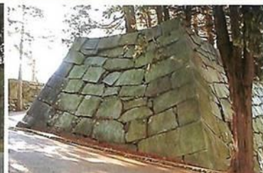
三の丸瓦御門枡形の石垣