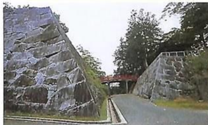
本丸(左)と二ノ丸(右)の石垣と空堀