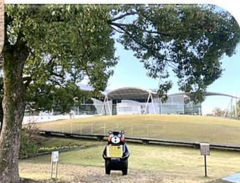
八代市立博物館未来の森ミュージアム (八代城跡の史料などの展示)