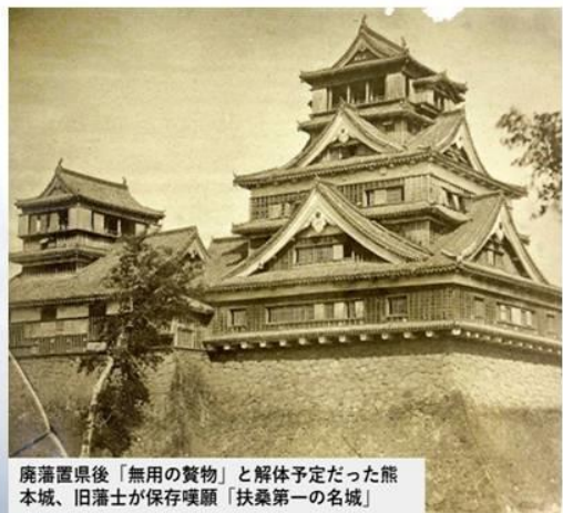
廃藩置県後「無用の贅物」と解体予定だった熊本城、旧藩士が保存嘆願「扶桑第一の名城」