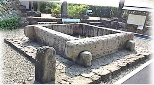
豊磐井 (とよいわのい) お城のある山の標高43mよりも更に深い、50mの深さがあります。巨大な岩で囲われた井戸です。