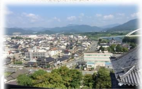
天守閣から望む福知山城下町