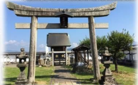
朝暉神社 (あさひじんじゃ)