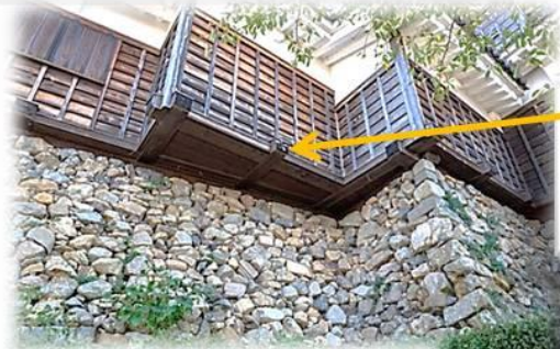
大天守と小天守を繋ぐ続櫓の「石落とし」。