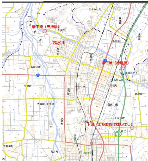
採水場所（3ヶ所：昨年）