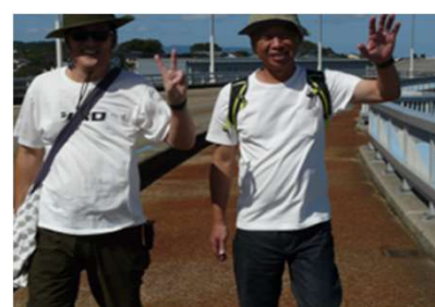
追い風を受けて最後の頑張り