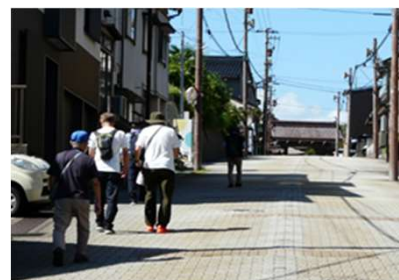
勝興寺総門が見えてきた