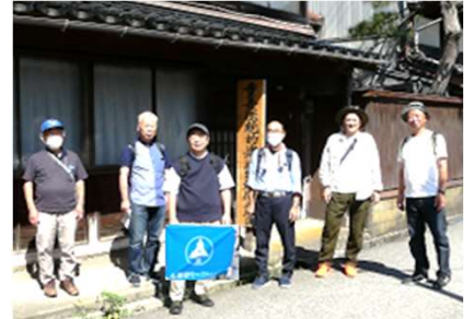
久伝統的建造物群保存地区

ここから歩こう会スタートです、吉久伝統的建造物群保存地区（江戸時代後期から近代に建てられた繊細な格子戸（さまのこ）が特徴の切妻造平入の町家）を抜け、2009年に完成した伏木万葉大橋を秋のさわやかな海風に抵抗しながら、一步一步上っていきました。橋の途中に奈良時代に越中国守として