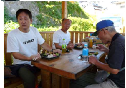
お店の前のベンチで昼食