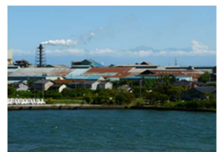
煙突の煙が真横に