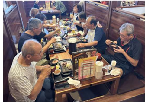
昼食で“エネルギー”充填!!