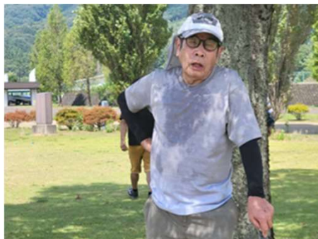
さすがにバテたな