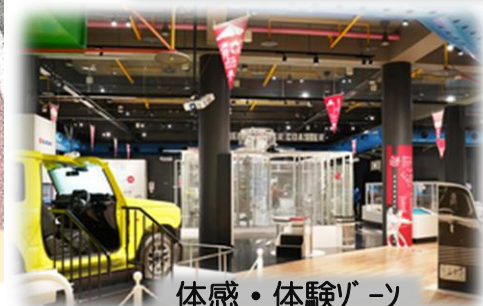
体感・体験ゾーン