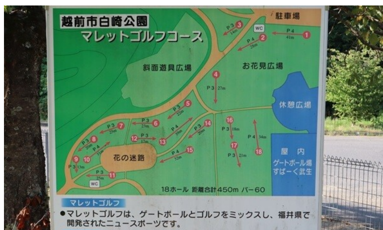
写真2. コース配置図