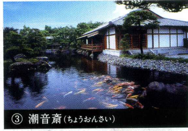
③ 潮音齋 (ちょうおんさい)