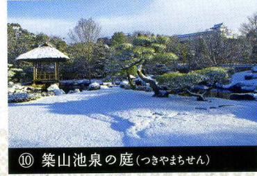
⑩ 築山池泉の庭 (つきやまぢせん)