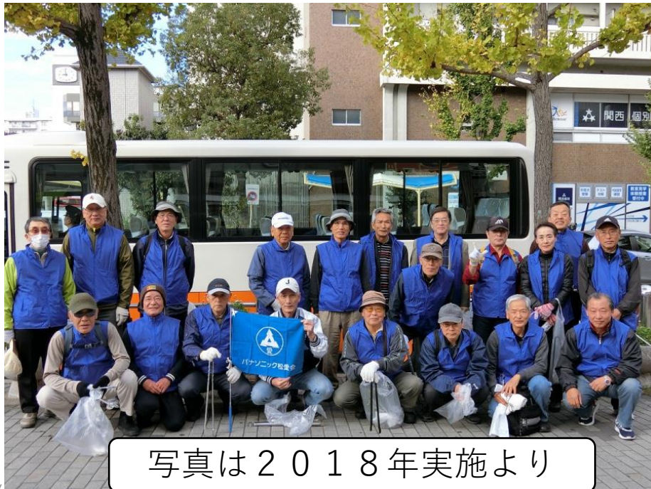
写真は2018年実施より

ボランティア活動の一環として、住んでいる地域の皆様に、 感謝の気持ちを表すために 、「市街地クリーン大作戦」を行いました。 他の多くのボランティア団体と共に、ハイキングの気分で街の美化に協力いたしました。