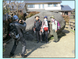
【HP】茨木摂津支部HP 同好会活動一北摂歩こう会