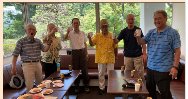
からおけ同好会開始します~乾杯!