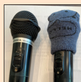
コロナ対策用マイマスク