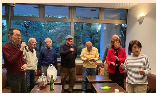
最後は全員で「六甲おろし」を唄い 阪神タイガース優勝の余韻を味わいました

参加者：9名 (会員総数：17名) 場所：パナソニックリゾート大阪カラオケサロン